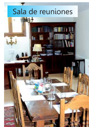
Sala de reuniones

«Si el Señor no construye la casa, en vano trabajan los que edifican»