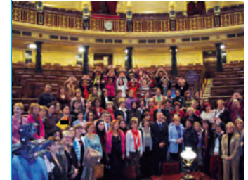
CELEBRACIÓN DE LA APROBACIÓN DE LA LEY DE VIOLENCIA DE GÉNERO.