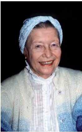
SIMONE DE BEAUVOIR

— ¡No se nace mujer! ¡Te hacen mujer! 1 .