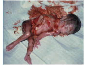
«INTERRUPCIÓN DEL EMBARAZO»

Sexismo , feminismo y machismo , son términos que preparan psicológicamente al lector para aceptar la teoría de la «lucha de clases» entre los sexos, que la ideología de género sustenta haber sido la clave que ha caracterizado toda la injusta historia de la Humanidad hasta la actual liberación, que ella preconiza.