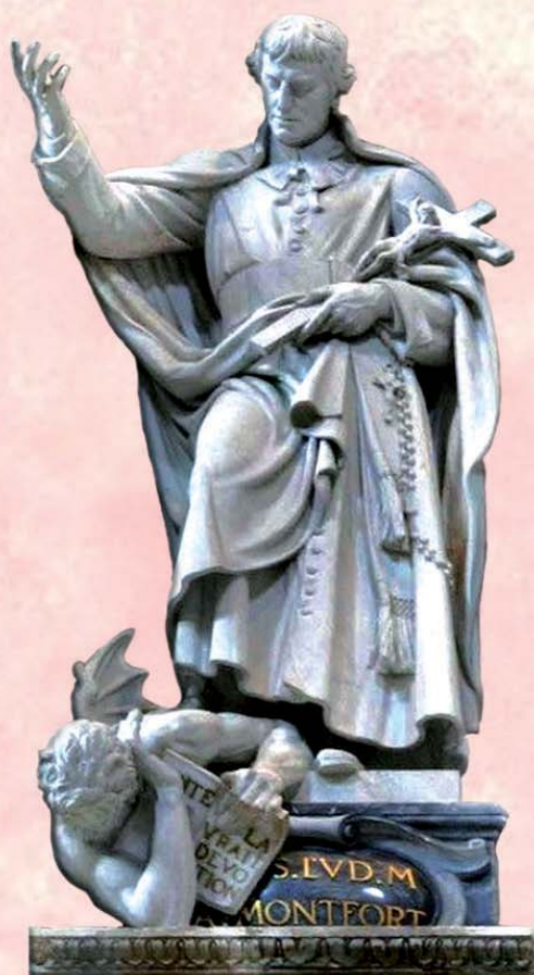
San Luis María Grignion de Montfort