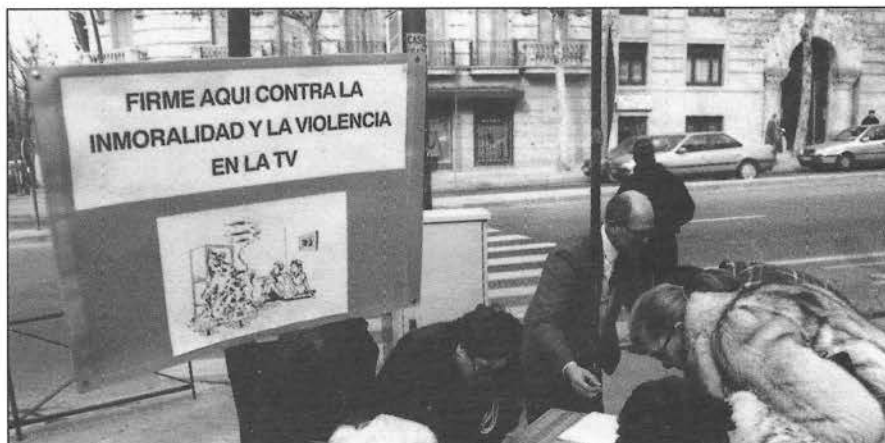
Adherentes de S.O.S Familia pidiendo firmas en la salida de una iglesia madrileña