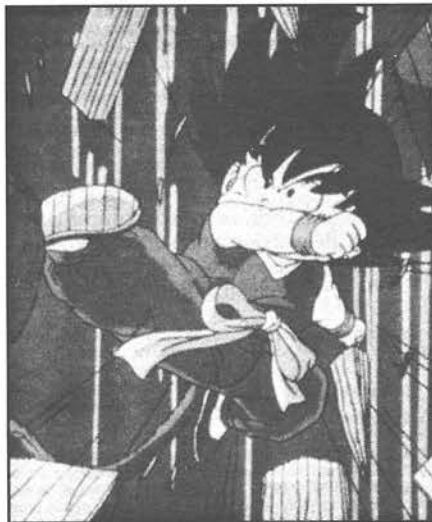
Las imágenes violentas ejercen una influencia negativa en el desarrollo del niño

que trata de la influencia del cine y la televisión, muestra el enorme alcance que los medios audiovisuales tienen en el proceso formativo de los niños.