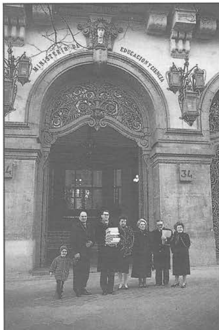
La Comisión de S.O.S. Familia, delante del Ministerio de Educación, momentos antes de ser entregadas las firmas.

organismo que fiscalizase seriamente su cumplimiento y que, a su vez, estableciese sanciones para aquellas cadenas que lo infringiesen.