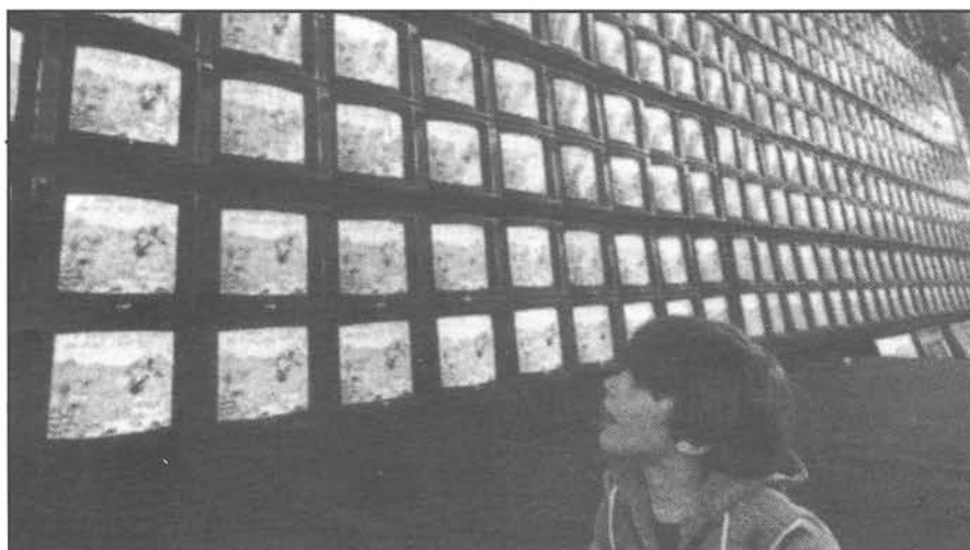
La TV, según los estudios más recientes, ejerce una influencia nociva en la formación de los niños.