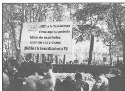
Numerosas personas se acercaban a la mesa para manifestar su protesta por la degradación moral de los programas televisivos.