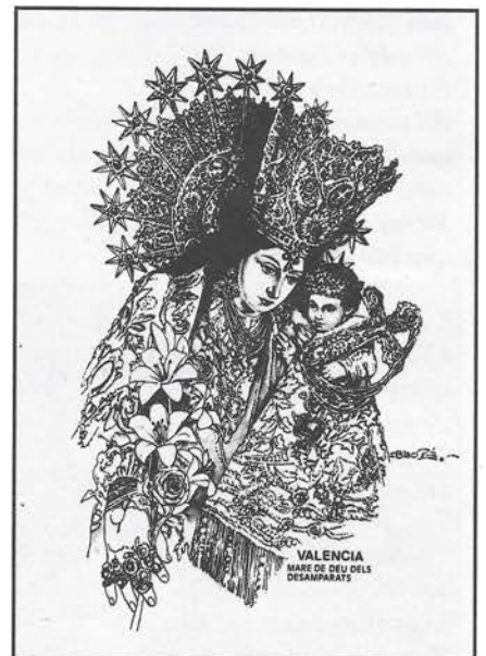
Nuestra Señora de los Santos Inocentes, Mártires y Desamparados.

Con esta disposición de espíritu, seguimos nuestra lucha colocando a los pies de la Virgen de los Desamparados todos nuestros esfuerzos, confiantes en que Ella se dignará a bendecirlos y producir los frutos que todos deseamos.