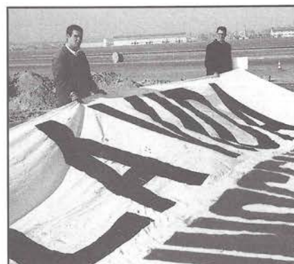
Momentos finales de los preparativos de la pancarta.