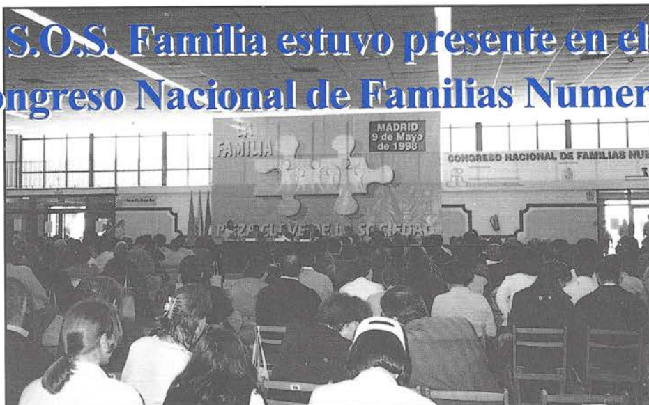
Aspecto parcial del Pabellón de Convenciones de la Feria del Campo, donde fue realizado el Congreso Nacional de Familias Numerosas

A lo largo del día pasaron por nuestro stand cientos de personas, llevándose numerosas publicaciones y suscribiendo nuestra campaña contra la posible comercialización de la píldora abortiva, así como contra la violencia y la inmoralidad en la TV.