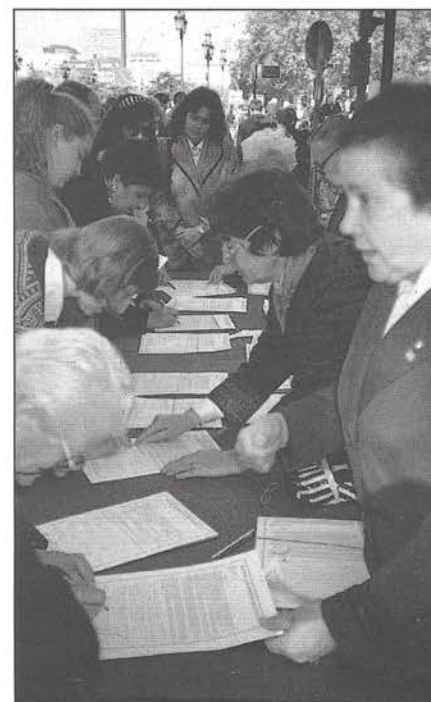
Propagandistas de S.O.S. Familia recogiendo firmas contra la píldora abortiva

Por todo ello, la carta concluía reforzando nuestra petición, avalada por más de 6.000 firmas, en el sentido de que fueran tomadas todas las medidas necesarias para evitar que sea comercializada la "píldora asesina".