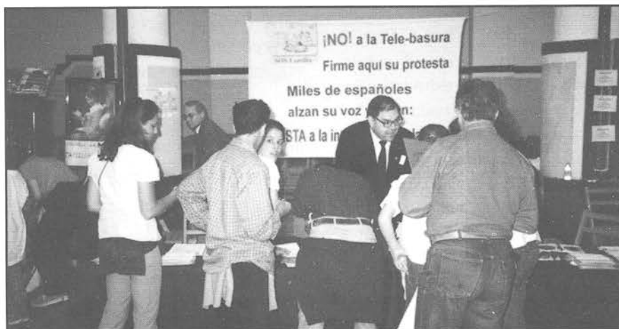
Numerosas personas visitaron a lo largo del día el stand de S.O.S. Familia