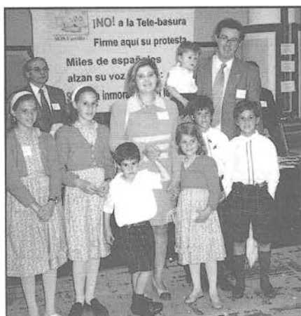
La presidenta de Familias Numerosas de Alcalá de Henares posa junto con su familia delante del stand de S.O.S. Familia

Al acto asistió un numeroso público y estuvieron representantes de las 16 asociaciones que componen la Federación.