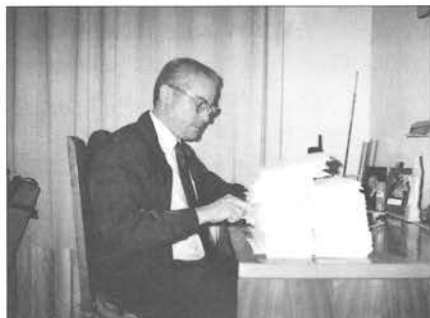
En un solo día llegaron a la sede principal de S.O.S. Familia, en Madrid, más de 1.000 cartas. En la foto, en el momento de abrir la correspondencia.

Desde un primer momento, todos los esfuerzos de S.O.S. Familia se centraron en pedir a los diputados nacionalistas que habían votado a favor del 4º supuesto la vez pasada que reconsiderasen su voto. Así se le decía en las miles de cartas y faxes que nuestros asociados les enviaron y que según ellos mismo llegaron a inundar sus casilleros en el Congreso de los diputados.