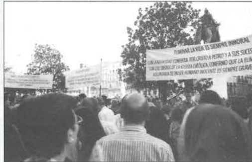
Las pancartas de S.O.S. Familia, con frases de S.S. Juan Pablo II condenando el aborto, despertaron un interés enorme en la concentración que se realizó en la Puerta del Sol, en Madrid.

Durante el acto, SOS Familia exhibió varias pancartas, con frases de S.S. Juan Pablo II condenando el aborto. Alrededor de las mesas que habían sido colocadas en