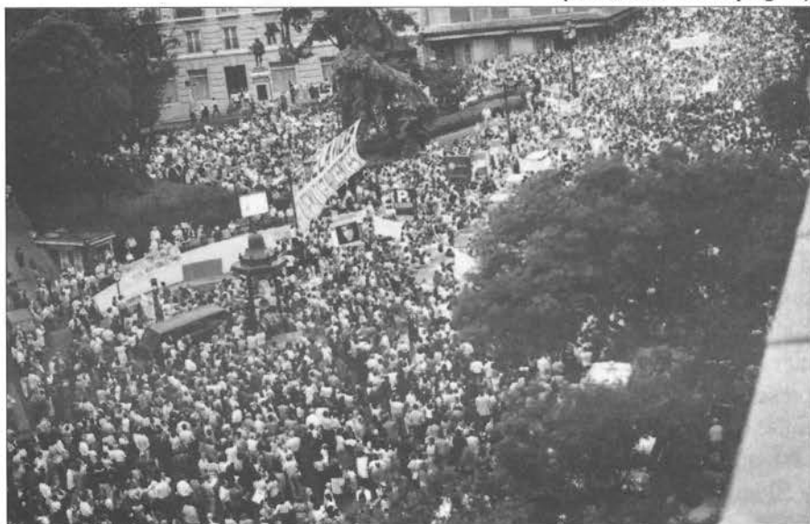
Miles de personas se concentraron frente al Congreso de los Diputados, para manifestar su oposición a la propuesta socialista de ampliación del aborto.