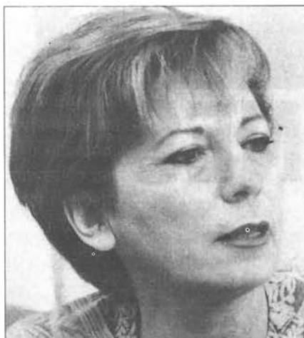
El voto contra el 4º supuesto de Celia Villalobos, junto con el de los cuatro diputados nacionalistas que cambiaron su posición, fue decisivo para rechazar la propuesta socialista.

El diputado de CiU por Barcelona, Ignasi Guardans, explicó así de claro el cambio de su voto: "He votado no porque la gente que me ha dado el poder para cambiar una ley no percibe en absoluto la necesidad de ampliar la del aborto" (El País, 23-9-98).