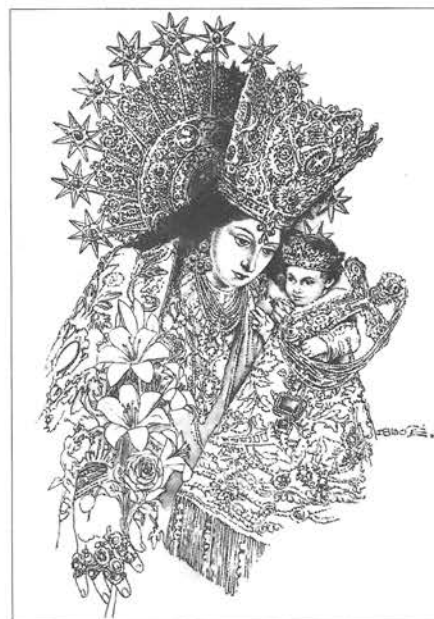
Nuestra Señora de los Santos Inocentes, Mártires y Desamparados, Patrona de Valencia.

Terminamos este artículo agradeciendo filialmente a la Virgen de los Santos Inocentes, Mártires y Desamparados -bajo la protección de Cuyo manto pusimos desde el primer momento todos los esfuerzos de esta campaña- toda la ayuda e intercesión con que se ha dignado favorecernos para conseguir aquello que desde el punto de vista meramente humano parecía imposible. Al mismo tiempo, le pedimos que nos siga ayudando, como hasta ahora lo ha hecho, para estar siempre vigilantes y seguir luchando para que esta sana reacción que se ha producido en la opinión pública española se mantenga siempre encendida, de manera que se le cierren definitivamente en España las puertas al aborto.