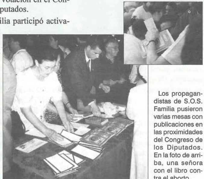
Los propagandistas de S.O.S. Familia pusieron varias mesas con publicaciones en las proximidades del Congreso de los Diputados. En la foto de arriba, una señora con el libro contra el aborto.

Durante la concentración se repartieron cientos de libros contra el aborto y 5.000 copias del anuncio que fue publicado en los periódicos, en el que se pedía a los diputados nacionalistas que votaran en contra de la ampliación del aborto. Además, se repartieron más de 1.000 hojas para que las personas enviaran por fax una petición a los portavoces de los grupos parlamentarios nacionalistas, para que exigiesen a los diputados de su grupo que votaran en contra del 4º supuesto. En total, sólo en Madrid, en los dos actos organizados en la Puerta del Sol, el día 8 de septiembre, y frente al Congreso de los diputados,