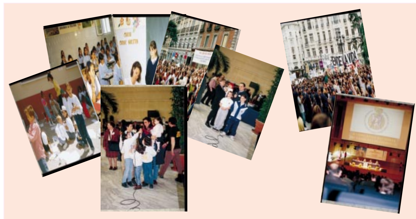
Algunas de las revistas docentes que publicaron la propaganda del vídeo de S.O.S. Familia

Aprovecho la presente para agradecerles en nombre de nuestra Comunidad Educativa dicho vídeo y para felicitarles por su calidad y oportunidad defendiendo una parcela que está siendo conculcada en la educación de nuestros hijos y en detrimento de la noble institución familiar. Atentamente, el Director. (Colegio Gran Capitán, Montilla, Córdoba).