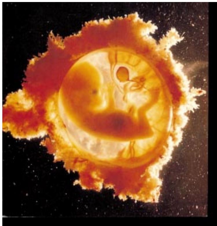
Cada ser humano es único, irrepetible e insustituible

Para la Conferencia Episcopal, “la píldora abortiva podrá camuflar el aborto, pero no despojarlo de su carácter de crimen ni de las graves implicaciones sociales y públicas que todo crimen comporta”. También recuerda el documento que la objeción de conciencia sigue siendo en el caso de la RU-486 “tan necesaria como en el caso del aborto quirúrgico”, al tiempo que hace un llamamiento a los católicos a oponerse sin vacilar a la “cultura mortífera” del aborto. (Cfr. ABC, 9-2-2000)