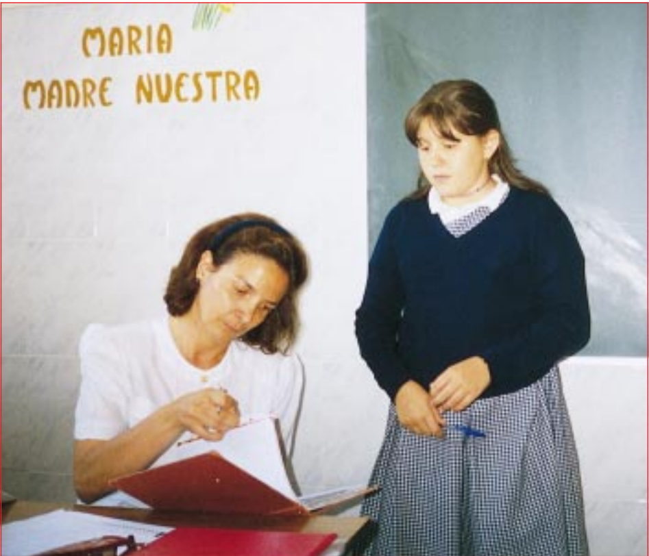
Muchas veces no se valora lo suficiente el tiempo que los profesores emplean con sus alumnos