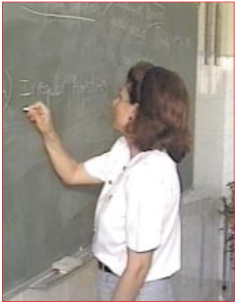
Frente al atrayente mundo de la TV, el maestro está en inferioridad de condiciones

fecunda y, por lo tanto, para que la formación de los jóvenes sea más plena.