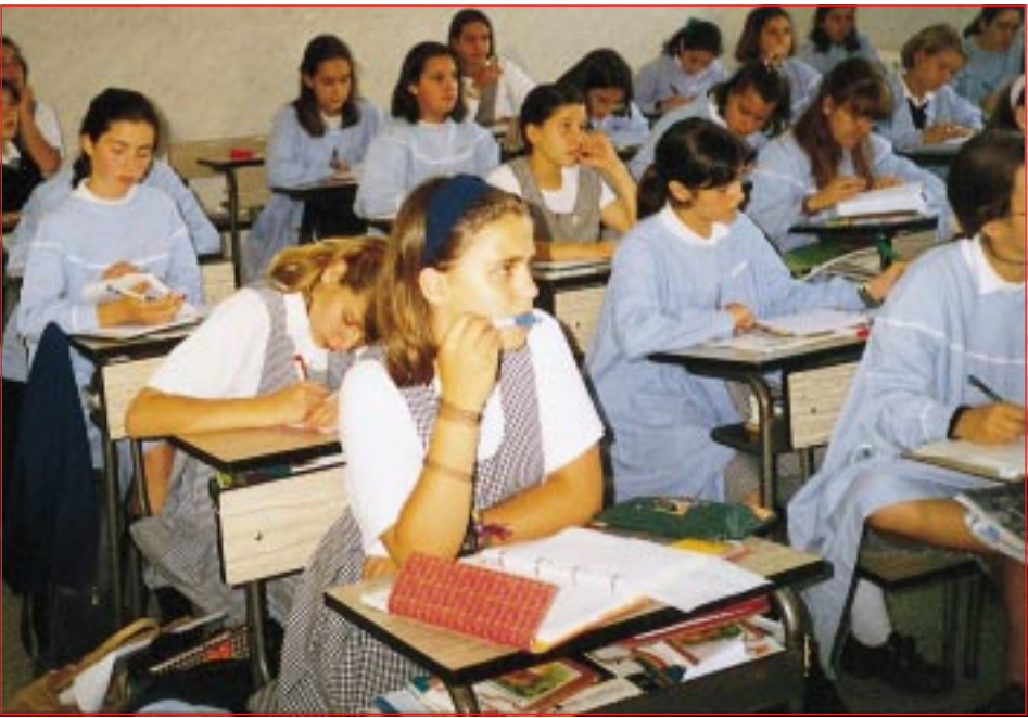
La TV no debe quitar a los escolares el tiempo de sueño necesario para estar atentos a la explicación del profesor

dad y de una educación en valores. La disciplina juega una papel muy importante, tanto en la escuela como en la familia. Ahora bien, muchos de los grupos que tienen un mayor índice de violencia escolar provienen de familias desestructuradas.