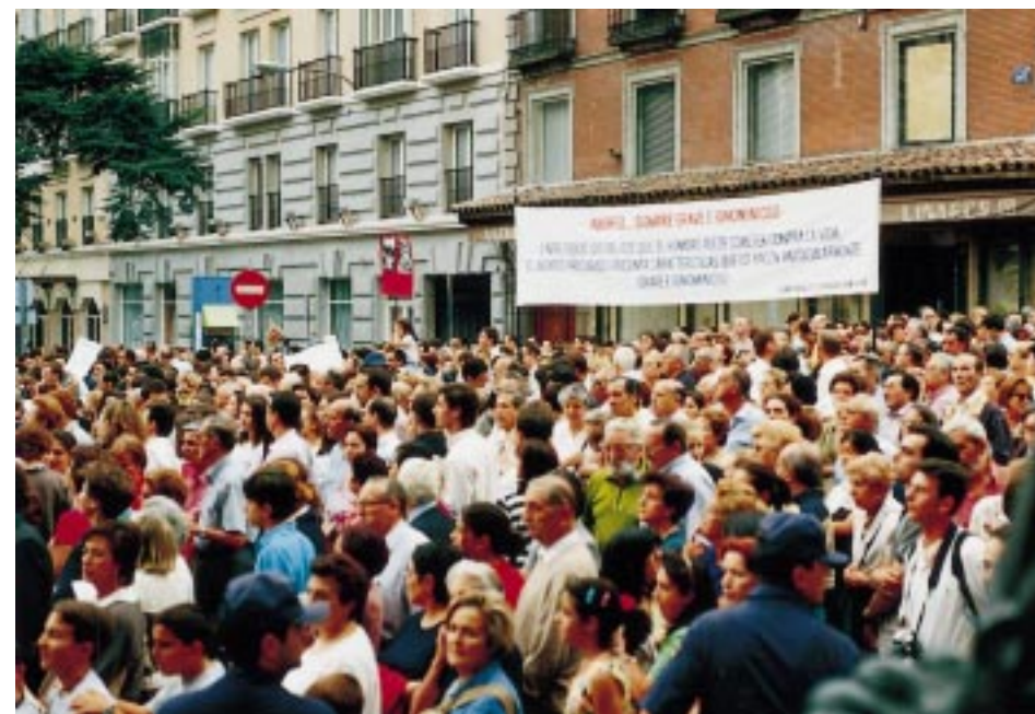
Manifestación contra el aborto, en septiembre de 1998, frente al Congreso de los Diputados, en las vísperas de la votación sobre el 4º supuesto

Les será imposible, por lo tanto, a los profesores -y también a los padres- evitar un desequilibrio en la formación del niño si no tienen un conocimiento general de lo que pasa en el pequeño universo de sus alumnos o sus hijos expuestos a la TV.