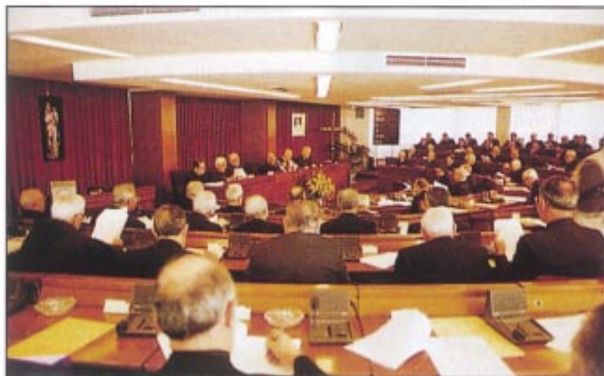
Asamblea Plenaria de la Conferencia Episcopal Española

Ante los grandes valores e ideales se extiende en muchos sectores un profundo escepticismo que actualmente afecta gravemente al campo moral. Con esta afirmación no nos referimos al rechazo de la normativa moral propuesta por la Iglesia, sino, sobre todo, a la incapacidad del hombre para construir su vida en la verdad.