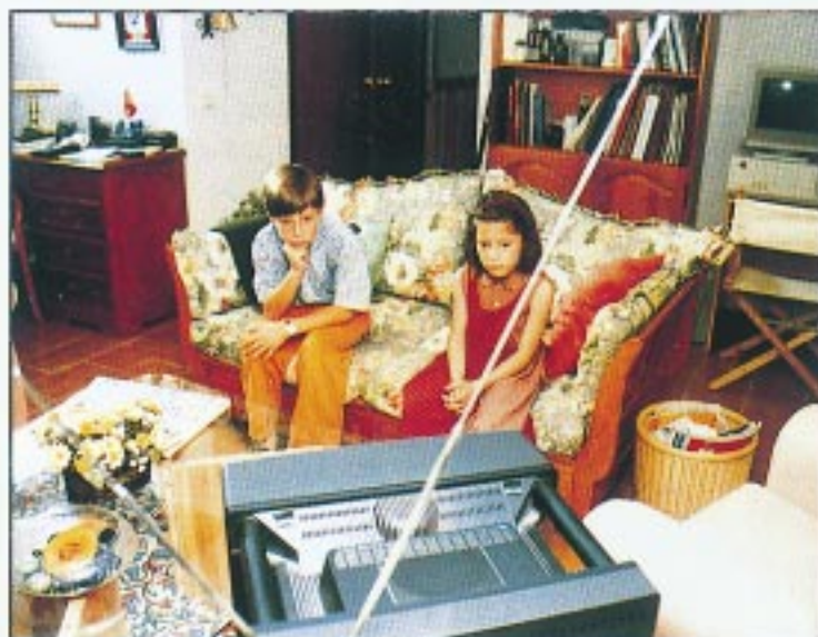
La juventud no está educada a la hora de ver la televisión

El estudio se centra muy especialmente en las posibles repercusiones del abuso televisivo en el rendimiento escolar y en la comunicación con la familia. Así, se pudo observar que la franja horaria en la cual nuestra juventud dedica más horas a ver la TV es por la noche. Ello origina dos hechos muy importantes a destacar: