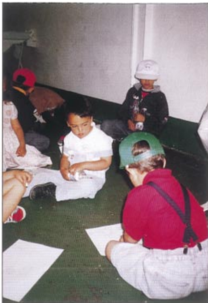
El aprendizaje es un proceso largo y laborioso que nunca termina

Como aparato de emisión de imágenes y sonidos podemos decir que fomenta una cultura juvenil basada en la imagen y el poder que dicho factor juega en nuestra sociedad. O sea, no sólo transmite las pautas de la sociedad, sino que, muchas veces, las manipula e impone sin que nosotros queramos los patrones comportamentales que interesan. Así nos encontramos con casos tan deplorables como la anorexia o la bulimia, enfermedad del occidente, padecida por jóvenes, cansados de verse torturados todos los días por modelos hiper delgados en extremo casi cadavéricos, que arrastran su estructura ósea por la pasarelas.