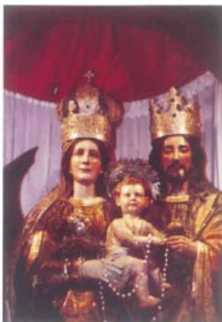
La Sagrada Familia: modelo para toda la sociedad

La generación de un hijo, que es amado por sí mismo, se prolonga en su educación. Los obispos constatamos no sin preocupación las dificultades que los padres de hoy