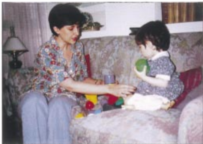
El papel de los padres es fundamental en el desarrollo cognitivo del niño.

Si bien que la mayoría de las personas reconocen que la televisión ha sido un gran invento, sin embargo la pregunta que debemos hacernos es: ¿qué utilización estamos dando a este medio que tanta influencia tiene en nuestro comportamiento?