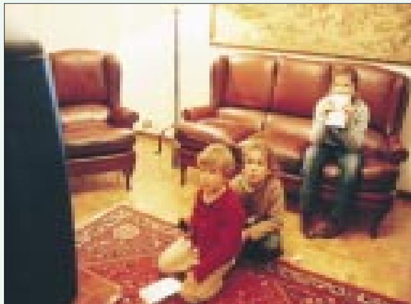
Los padres están cada vez más preocupados por los contenidos violentos e inmorales en la televisión

En Francia, por ejemplo, una Comisión integrada por educadores, juristas, filósofos, pediatras y periodistas, aconsejó, el pasado mes de noviembre, al Gobierno prohibir en los medios