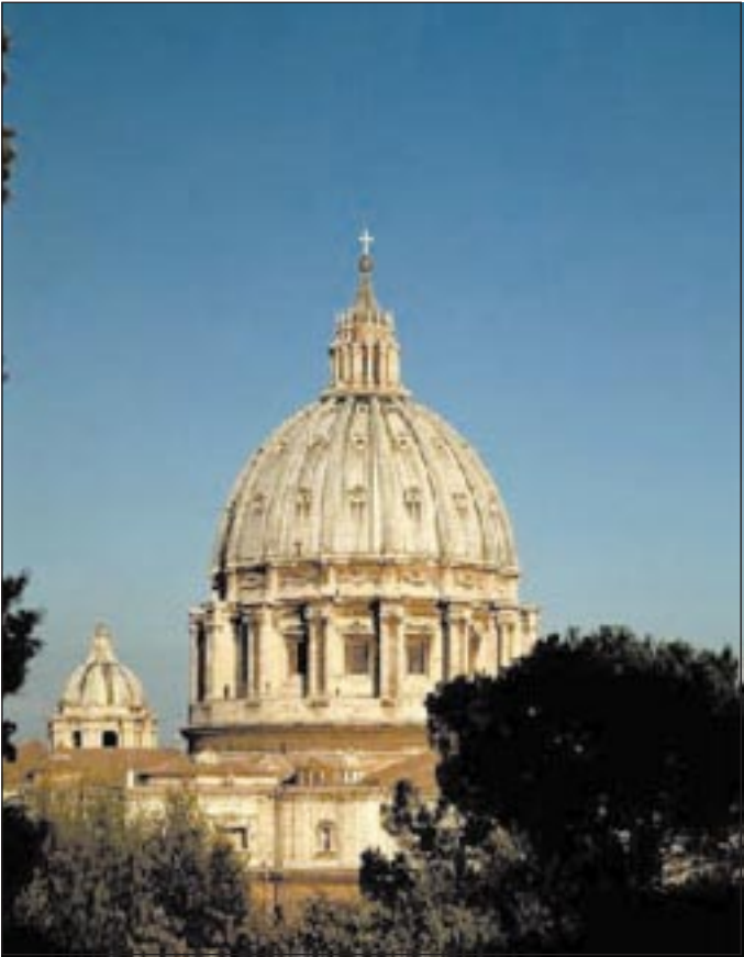
La televisión absorbe la mayor parte del tiempo libre de los niños

televisivos la violencia y la pornografía, entre la 6,30 de la mañana y la 10.30 de la noche.