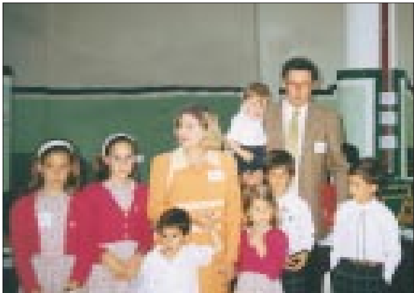
España es uno de los países de la UE que concede menos ayuda por hijo