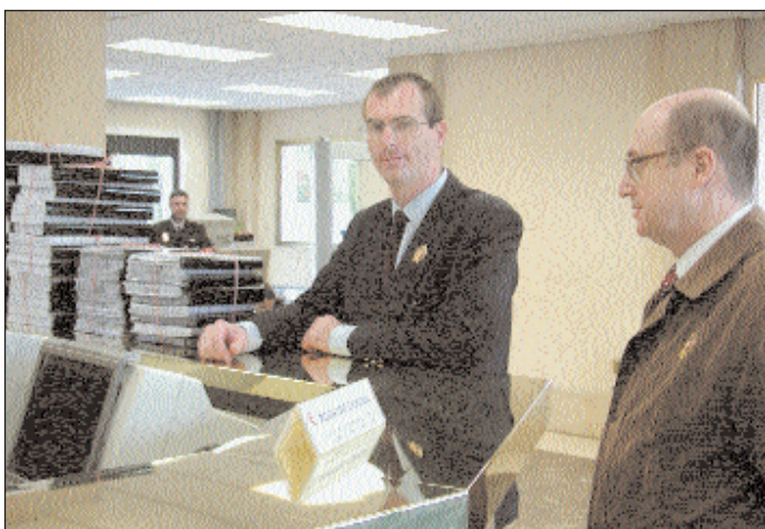
Los directivos de S.O.S. Familia en el momento de la entrega de las firmas, en el Palacio de la Moncloa.