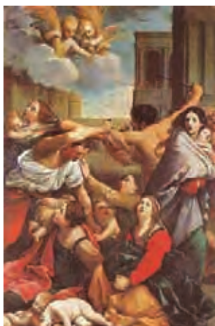
Matanza de los inocentes. Tapiz grabado por Raimondi

Con el aborto, «cada día se lleva a cabo una verdadera matanza de inocentes», ha denunciado el Papa Juan Pablo II. ¿Quedarán estos crímenes para siempre impunes?