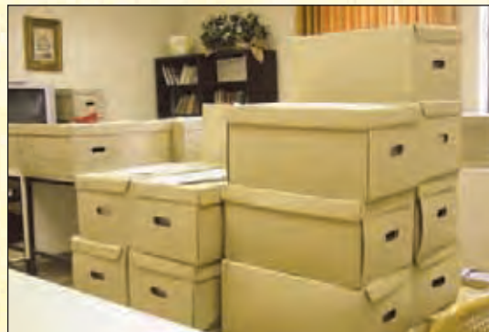
En un enorme salón de la sede de CONCAPA, en Madrid, se contabilizan, ordenan y colocan en cajas los millones de firmas a favor de la educación religiosa en las escuelas. Una auditoría ha iniciado su labor de verificación del número y autenticidad de las firmas antes que sean entregadas al Presidente del Gobierno.

Otro de los aspectos que más indigna al público es la imposición de una escuela laica, que obliga a impartir una enseñanza que ignora o niega la existencia de Dios. ¿Qué calidad moral y académica puede tener una educación que omite el fundamento de la existencia humana, la razón de la vida, la base de