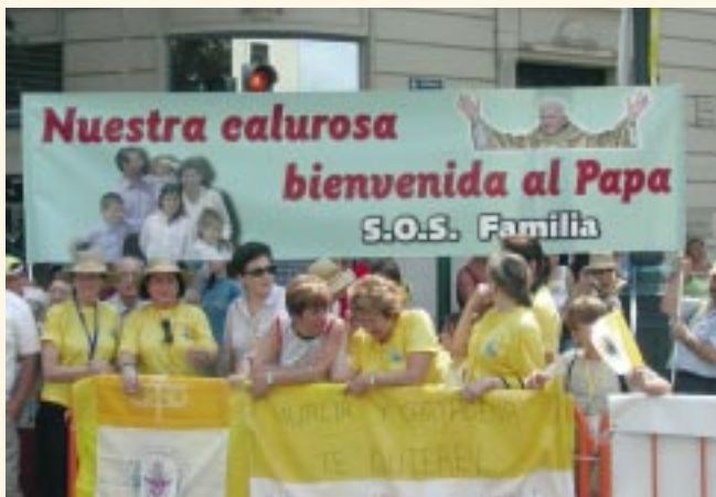
Situada en un lugar céntrico de Valencia, una delegación de S.O.S. Familia espera ansiosa la llegada del Papa

En el transcurso de la llegada del Papa, S.O.S. Familia quiso manifestarle su cariñosa bienvenida