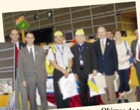
Obispos de todo el mundo