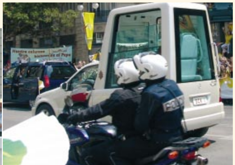
¡Y el Papa que pasa saludando y dando su bendición!