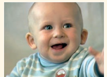
¡Papás! En agrad cimi nto por hab rm d jado nac r,l s traigo 2.500 uros d bajo d l brazo

Si bien que la medida de pagar 2.500 euros por hijo puede ser considerada insuficiente y electoralista, lo que importa es que constituye el primer reconocimiento aunque tímido e implícito, del fracaso de una política nefasta que nos llevó a este suicidio colectivo que constituye el antinatalidad.