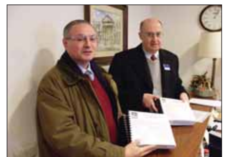
Entrega de la Petición de S.O.S. Familia en el Congreso, el día 9 de Enero de 2009.

Se trata, entretanto, de la cuestión fundamental para la cual la ideología abortista no tiene respuesta ni salida. Por eso hay que imponer la disciplina partidista, hay que impedir que se oiga la voz de la Iglesia y de la ciencia seria, hay que centrar las discusiones en cuestiones colaterales.