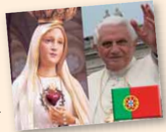
1) Encuentro con las organizaciones de la Pastoral Social, 13-5.2010.

Todo esto está muy en sintonía con el mensaje de Nuestra Señora, que resuena en este lugar: la penitencia, la oración, el perdón en aras de la conversión de los corazones 1 .