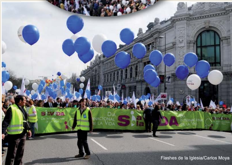
Flashes de la Iglesia/Carlos Moya

Aspectos de la Vigilia en la Colegiata de San Isidro de Madrid. Además de una gran campaña publicitaria bajo el lema siempre hay una razón para vivir, en 70 catedrales de España se celebraron solemnes vigiliass por la vida. Veinte mil sacerdotes ofrecieron sus Eucaristías y un millar de conventos contemplativos se unieron con sus oraciones a la misma intención.