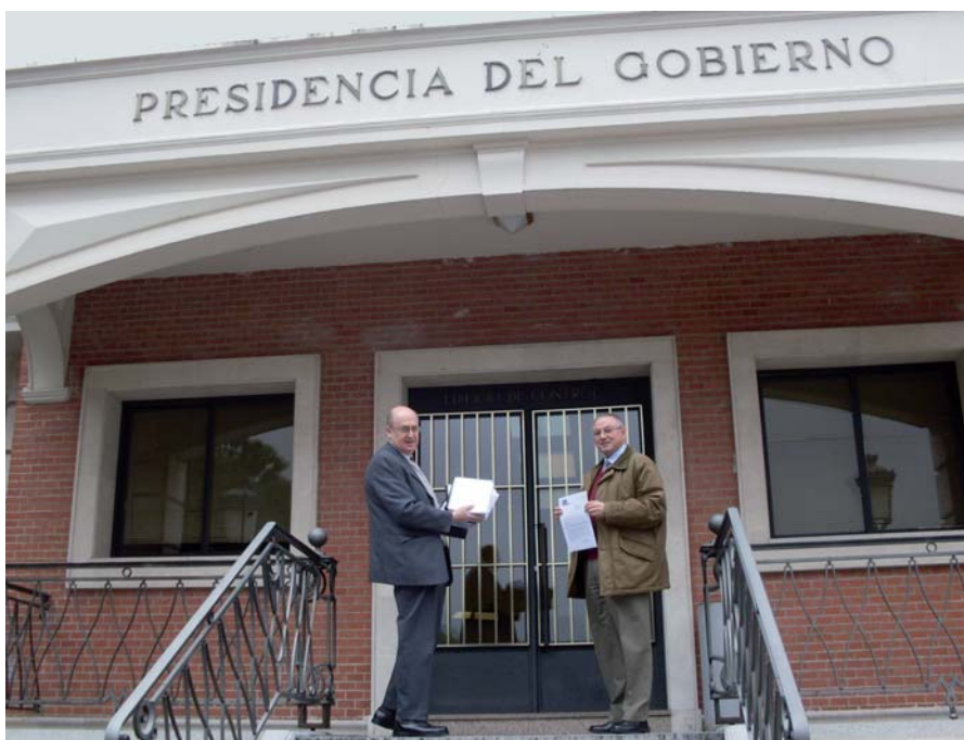
S.O.S. Familia hizo entrega al ministro Sr. Pérez Rubalcaba de una primera remesa de firmas en el Palacio de la Moncloa.

Es el género y no el sexo lo que caracteriza al ser humano; género que cada uno escoge libremente y variando según sus apetencias carnales del momento.