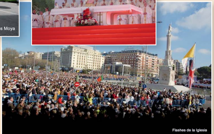
Flashes de la Iglesia