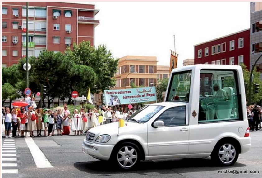
Frente a la Plaza Cataluña, S.O.S. Familia dio la bienvenida al Papa en su llegada a Madrid, el jueves día 18 de agosto.