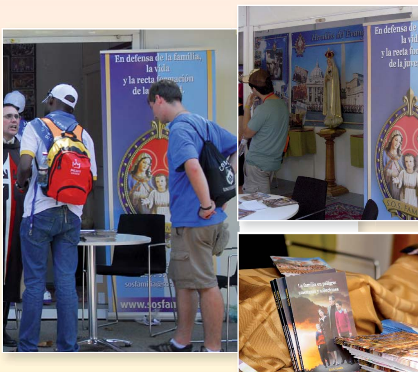
Dentro del amplio stand de los Heraldos del Evangelio, en el Parque Retiro, S.O.S. Familia dio a conocer su labor durante los cinco intensos días de la Feria Vocacional de la JMJ.

Decenas de miles de personas visitaron el stand donde se difundieron millares de publicaciones de la entidad. Las más solicitadas fueron el libro La familia en peligro: amenazas y soluciones , un opúsculo explicativo de la entidad que narra su actuación desde el año 1991 y los folletos divulgativos sobre aborto, píldora del día después, anticonceptivos, ideología de género y «muerte digna».