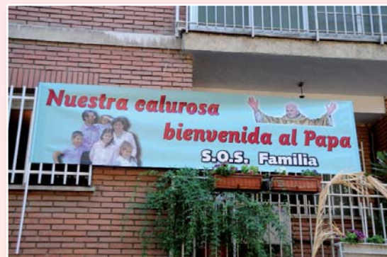
Desde las ventanas de las oficinas de S.O.S. Familia el homenaje público a Benedicto XVI.