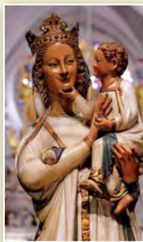
La Virgen Blanca, de Toledo, ilustra el saludo navideño del Nuncio Apostólico de S.S. el Papa Benedicto XVI

Felicitaciones del Cardenal Lluís Martínez Sistach, Arzobispo de Barcelona