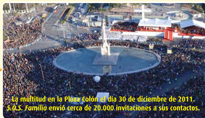
La multitud en la Plaza Colón el día 30 de diciembre de 2011. S.O.S. Familia envió cerca de 20.000 invitaciones a sus contactos.