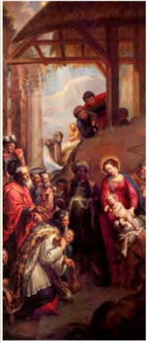
Tarjeta de Navidad del Cardenal Rouco Varela

En Navidad, un Niño nos ha nacido... y el cariño de los simpatizantes de S.O.S. Familia se hace presente en las centenas de felicitaciones que recibimos. Son mensajes destinados a cada uno de los colaboradores de la entidad a quienes damos a conocer en este Boletín y que les ayudarán a comprender mejor la magnífica labor que han llevado a cabo generosa y desinteresadamente durante el año que pasó.