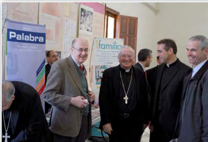
El Cardenal Ennio Antonelli, Presidente del Pontificio Consejo para la Familia conversando animadamente con dirigentes de S.O.S. Familia.