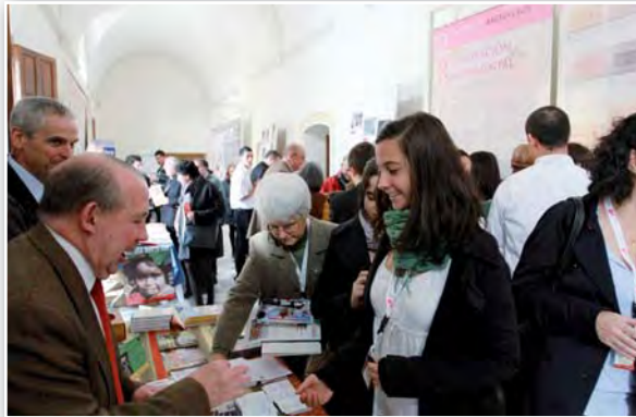
El concurrido stand de S.O.S. Familia durante el Congreso que se realizó en el histórico Palacio Arzobispal de Alcalá.