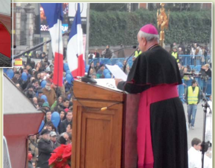
Mons. Vincenzo Paglia