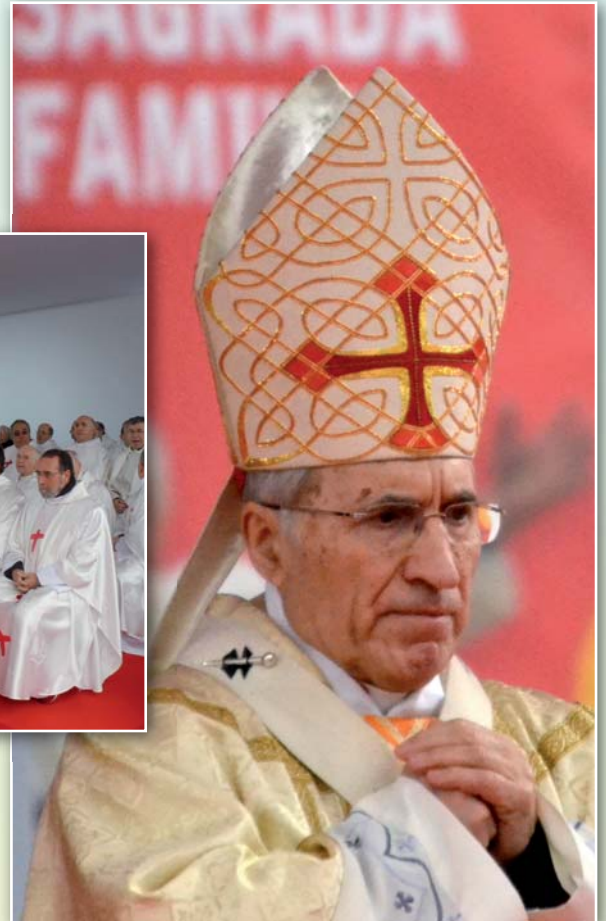
Cardenal Rouco Varela