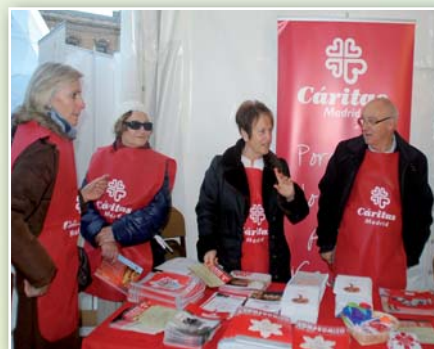
Mesa de CÁRITAS