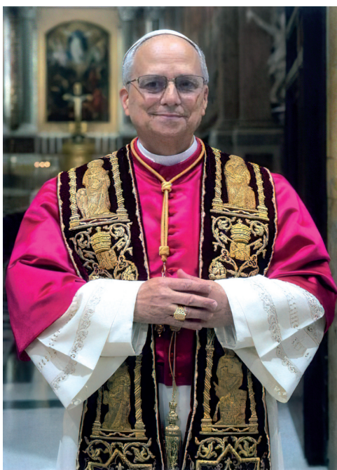
León XIV 8 maggio 2025

Una de las primeras enseñanzas de León XIV llenó de ánimo a los defensores de la familia y la vida. Dirigió un mensaje a los gobiernos del mundo entero, a través de sus embajadores acreditados ante la Santa Sede, reafirmando con claridad la doctrina católica sobre la familia, la dignidad del ser humano desde la concepción, marcando así las prioridades de su pontificado: